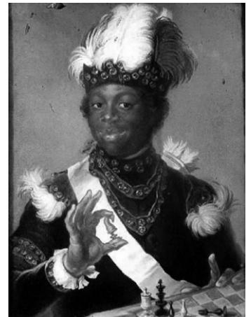
Gustav Badin in einem Portrait von Gustav Lundberg (1775)

Diese Geschichte inspirierte den Filmemacher Amir Chamdin und der Choreograf Pär Isberg zu einem Ballett, »Gustavia«, das 2024 an der von König Gustav III. gegründeten Königlich Schwedischen Nationaloper mit großem Erfolg aufgeführt wurde und als Film auf Internet-Plattformen zu sehen ist. Die Hauptrolle tanzt der senegalesisch-französische Ballettstar Guillaume Diop, der erste schwarzen Tänzer, der ein »étoile« ist, der höchste Rang im Ballett der Pariser Oper. Mit seinem Manifest »De la question raciale à l'Opéra de Paris« (2018) erreichte er eine Änderung der Diversitätspolitik der Pariser Oper.